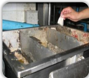
ที่ดักไขมันขนาดเล็กในครัว

“NeoBio® O&G ย่อยสลายไขมัน, ทำให้บ่อดักไขมันไม่ถูกรบกวน และง่ายต่อการรักษา”