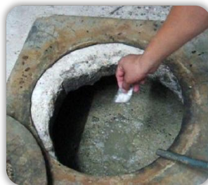
บ่อดักไขมันขนาดใหญ่

ทุกวันในช่วง 10 วันแรก หลังจากนั้นใส่ทุกๆ 2 สัปดาห์เพื่อรักษาสุขภาพและคงประสิทธิภาพสูงสุด